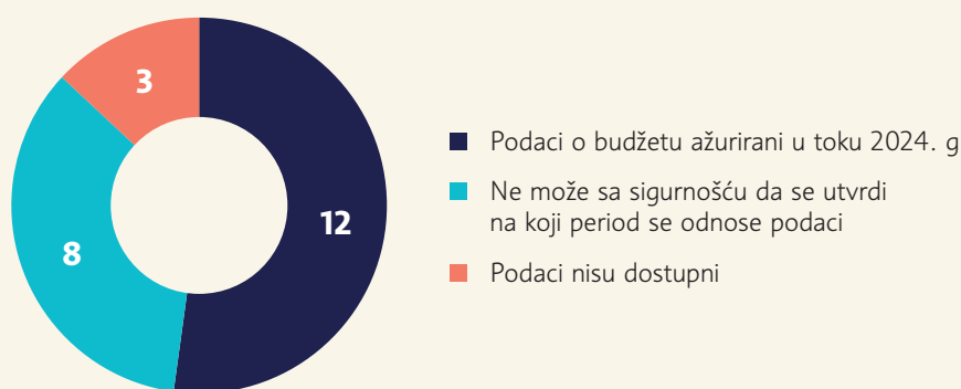
Grafikon 1: Rezultati pretrage Jedinog informacionog sistema informatora o radu